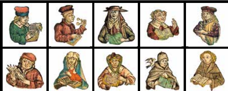
Bilder aus der Schedelschen Weltchronik 1493

Prüfeninger Straße 86 93049 Regensburg www.ambulanter-dienst- regensburg.de